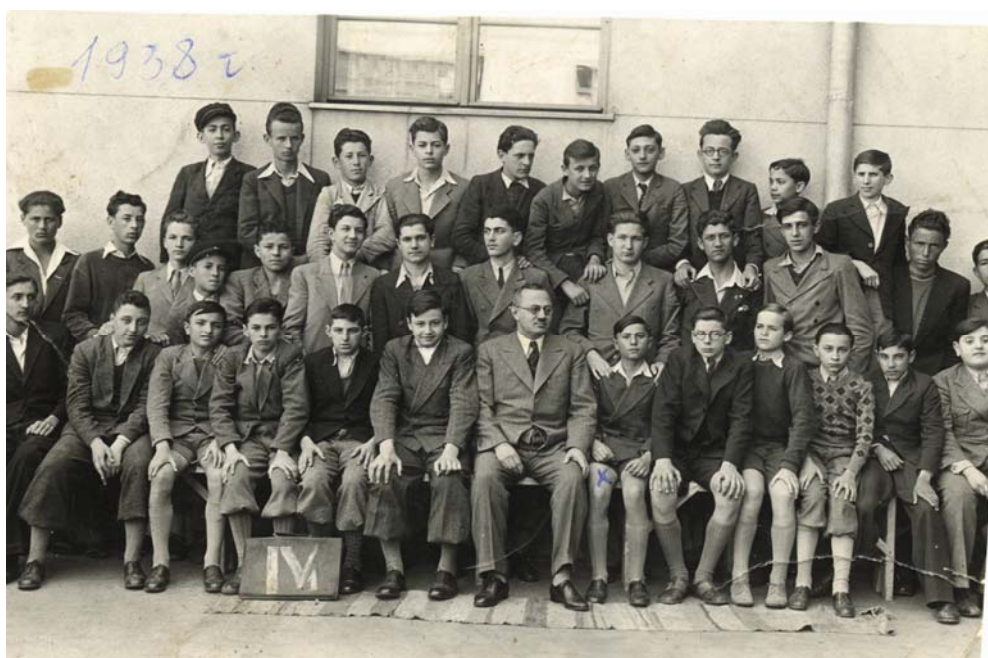
I beogradska gimnazija – generacija 1938.

Na teritoriji pod Vojnim zapovednikom u Srbiji bilo je 2.250 osnovnih (narodnih) škola. 15 Ipak, od jeseni 1941. radile su gotovo sve osnovne škole u Srbiji i većina gimnazija. Na početku školske 1941/1942. godine 1. septembra otvoreno je 2.113 osnovnih škola koje je pohađalo 365.583 đaka. 16 Na početku školske 1942/1943. godine bilo je 2.099 narodnih škola sa ukupno 367.360 đaka. Na jednu narodnu školu dolazilo je 175 učenika, a na svako odeljenje 58. 17