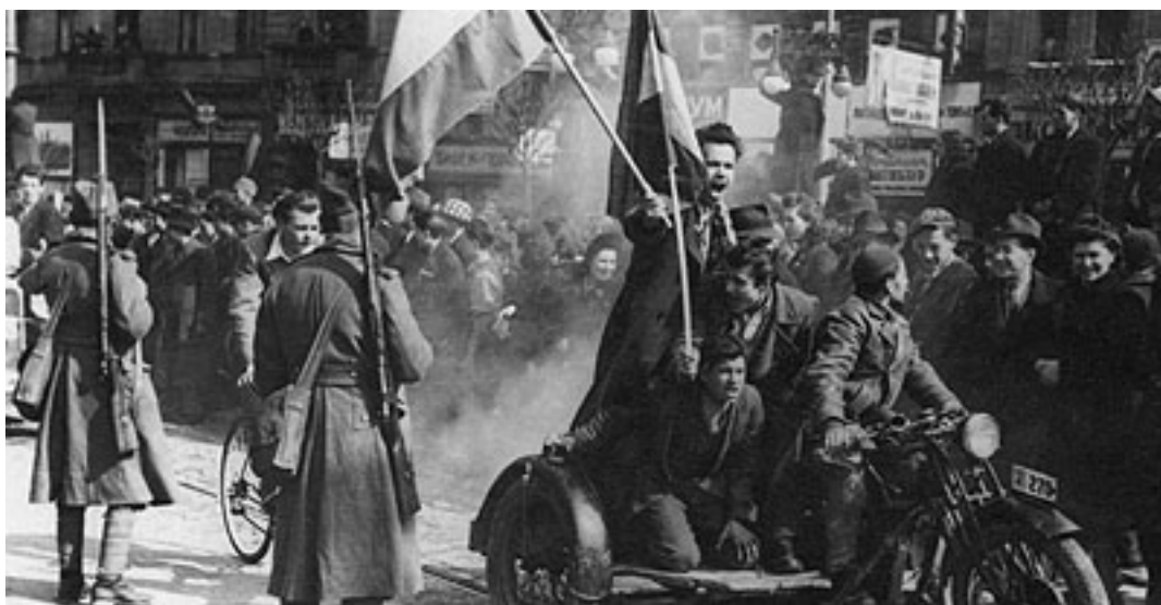
Demonstracije 27. marta 1941.

Nemačka propaganda u Srbiji, za njom i srpska dirigovana propaganda teško stanje u kojem su se Srbi našli objašnjavali su velikim zabludama i pogrešnim političkim odlukama koje su donosile njihove vođe. Najfatalnija je bilo odricanje od sopstvenog nacionalnog bića i prihvatanje zapadnih liberalnih uticaja što je dovelo do stvaranja Jugoslavije u kojoj se Srbija utopila.