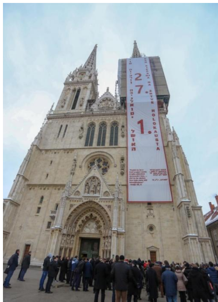
The Banner on Zagreb Cathedral

Dan sjećanja na žrtve Holokausta obilježen je ove godine u Hrvatskoj mnogo snažnije nego proteklih godina. Bilo je mnogo skupova u raznim hrvatskim gradovima u organizaciji i židovskih i nežidovskih udruga. Pažnju javnosti i medija ipak je najviše privukao iznenađujući skup pred zagrebačkom katedralom u organizaciji katoličke crkve. Ugodnom iznenađenju doprinjeo je sam kardinal Bozanić koji je u svom govoru izričito osudio zločine u notornom ustaškom logoru Jasenovac za vrijeme Holokausta. Evo nekoliko rečenica iz kardinalovog govora: