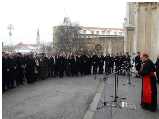
Commemoration in front of Zagreb Cathedral

The memory to the victims of the Holocaust has been marked this year in Croatia more strongly than in past years. There were many gatherings in various Croatian cities organized by both Jewish and non-Jewish associations. The attention of the public and the media, however, was most impressed by the surprising set-up before the cathedral in Zagreb organized by the Catholic Church. Cardinal Bozanić, who in his speech explicitly condemned the crimes in the notorious Ustasha camp Jasenovac during the Holocaust, contributed to a pleasant surprise. Here are few sentences from the Cardinal's speech: