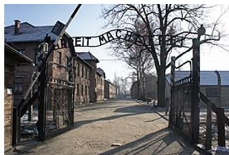
Entrance to Auschwitz