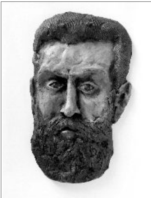
5. HERCL, Jovan or evi