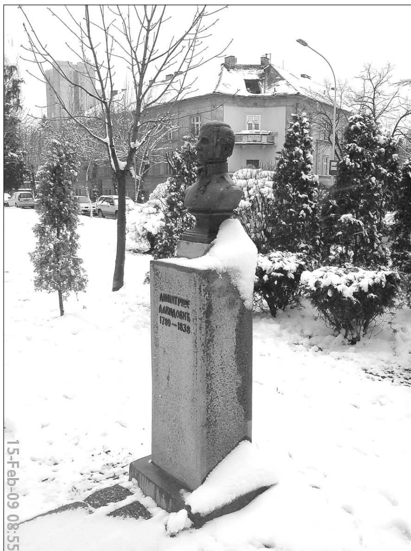
Споменик Димитрију Давидовићу на Кежу у Земуну, рад непознатог аутора. постављен 23. октобра 1989. године поводом 200. годишњице рођења (снимљено 15. фебруара 2009)