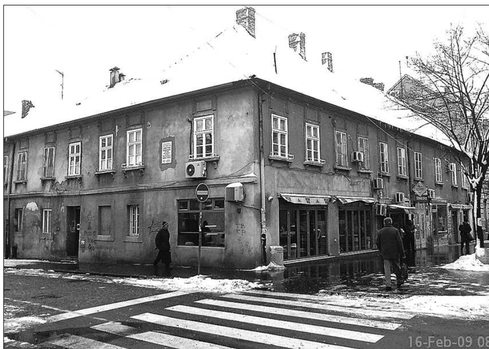
Данашњи изглед Зграде у Земуну, у Главној улици бр. 9, са спомен плочом постављеном 23. октобра 1985. године (снимљено 16. фебруара 2009)