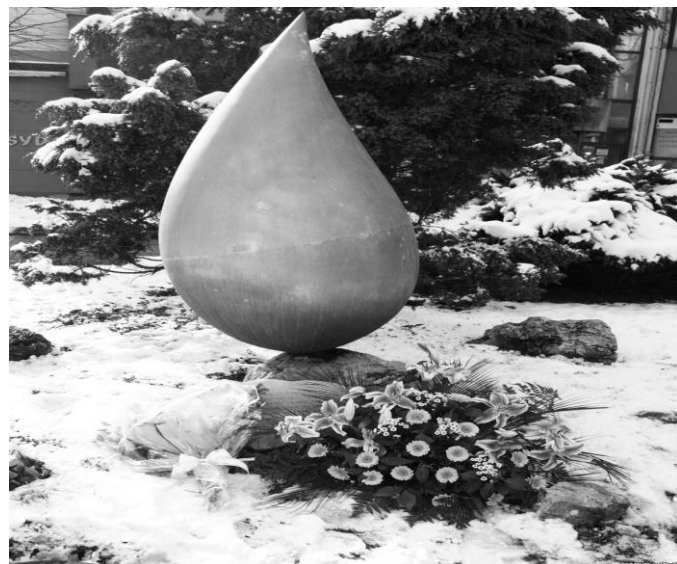
Tuzla: Na mestu nekadašnjeg kolodvora, postavljena je skulptura „Suza“