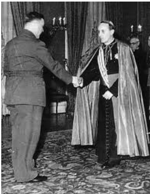
Korak do sveca - Stepinac i ustaški vođa Ante Pavelić