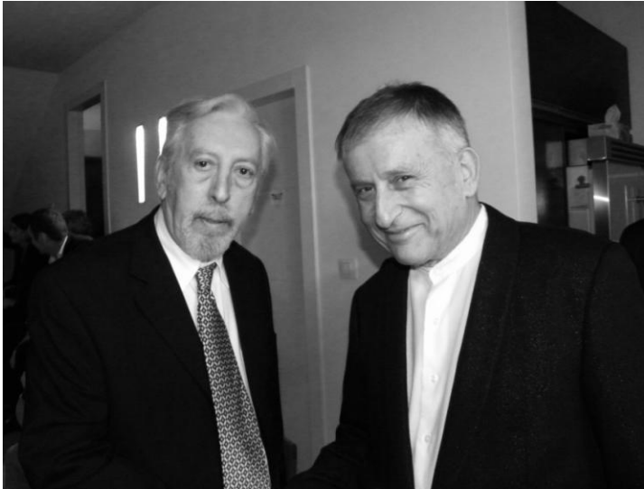
Ambasador Srbije Zoran Basaraba (desno) u prijateljskom razgovoru sa urednikom Mosta Milanom Fogelom (levo)

radnika iz Srbije (i iz Republike Srpske) koja bila učesnik edukativnog programa u Jad Vašemu. Verujem da će se uskoro rešiti i pitanje spomenika žrtvama logora Staro Sajmište, što je, nažalost, komplikovano zbog urbanističke lokacije.