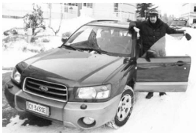
Humanost na delu

Vozilo je odmah stavljeno u promet i prevezlo svoje prve pacijente. U ime pacijenata i djelatnika, iz Doma zdravlja Mostar iskreno su zahvalili na ovom humanom gestu.