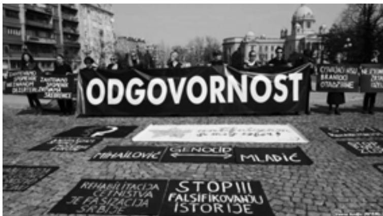
Protest u Beogradu

Dr Ivo Goldstein , profesor na Filozofskom fakultetu u Zagrebu, istoričar: ‘Ionako tešku situaciju u BiH, rehabilitacija Draže Mihailovića može samo pogoršati, ovakve ideje mogu dovesti samo do novog talasa istorijskog revanšizma. Liberalno-demokratska javnost, kako u Srbiji tako i u BiH i u Hrvatskoj, je zgrožena i tomu se protivi’.