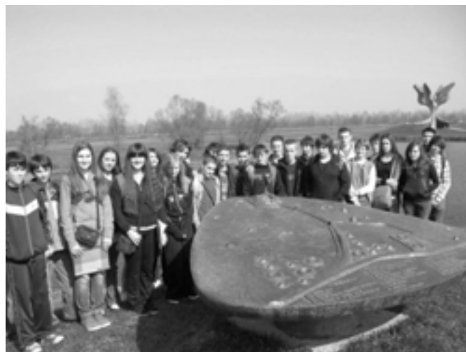
Učenici Jalžabeta na putu do kamenog cveta

tog prostora. Nakon posjeta školska knjižnica je obogaćena sa 10 novih naslova vezanih za ratnu tematiku. Šteta da samo mali broj škola u Hrvatskoj, oko 5 %, uključuje posjet Jasenovcu u svoje programe, iako su učenici u anketi većinom izjasnili da podržavaju ovakve posjete. Naša škola je jedna od vodećih u Hrvatskoj u poučavanju o Holokaustu i programu prevencije diskriminacije pa nam je posjet Jasenovcu važni dio nastave za koji smo se pripremali cijele školske godine. U takvom muzeju učenici mogu mnogo naučiti, ali što je važnije – steći dojam o progonima nevinih i razviti suosjećanje prema tim stradalim ljudima. Ako će to imalo djelovati pozitivno na razvoj njihove osobnosti, onda smo postigli svoj cilj, rekao je prof. Milivoj Dretar. Nastavak terenske nastave se održao na poznatom izletničkom odredištu Podgarić na Moslavačkoj gori. Unatoč teškoj tematici, učenici su bili oduševljeni ovakvim vidom nastave.