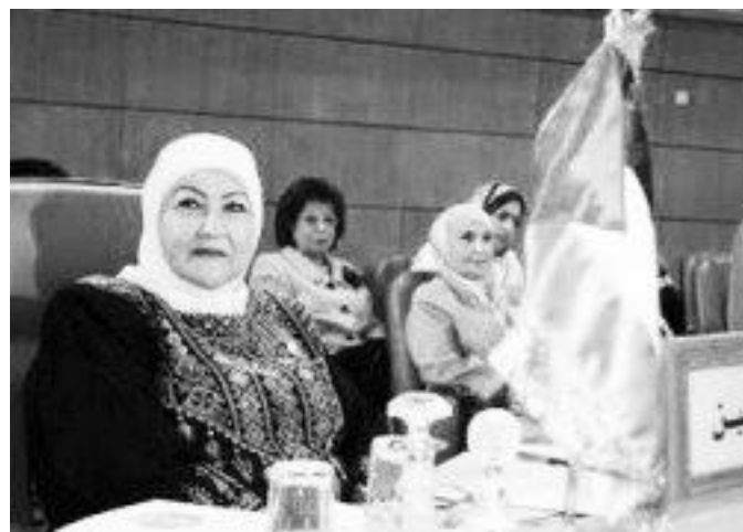
„Prva dama Palestine“ na konferenciji Arapske ženske organizacije u Tunisu 2010. godine

Abasa (Abu Mazena), oporavlja u privatnoj bolnici u Tel Avivu, nakon operacije u procesu transplantacije kolena.