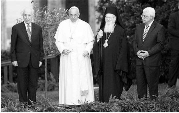
S leva na desno: Šimon Peres, Papa Franja, Patrijarh Vartolomej I i Mahmud Abas

Na svom poslednjem putovanju, kao predsednik Izraela, Šimon Peres je na poziv Pape Franje, da zajedno sa Abu Mazenom (Mahmud Abasom) mole za mir, boravio u Vatikanu. Sa njima se zajedno milio i Vaseljenski Patrijarh pravoslavne crkve Vartolomej I.