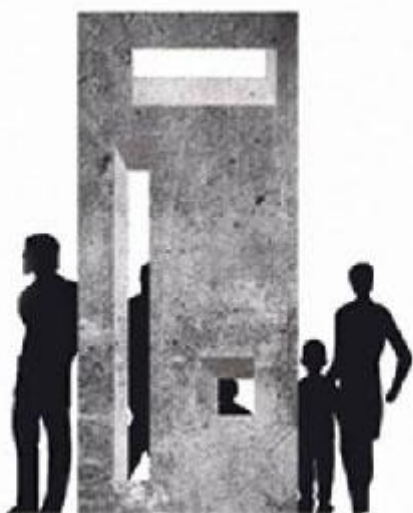
Spomenik je rad arhitekta Ane Korice

Istoričar Milan Koljanin dao je objašnjenje zašto je ova lokacija važno mesto sećanja: „Tom maršutom je prolazio kamion-gasna komora. Pored srušenog mosta kralja Aleksandra je u vreme nemačke okupacije bio izgrađen pontonski most, tako da je kamion koji je vodio zatočenike, uglavnom žene i decu iz jevrejskog logora na Sajmištu, odatle prelazio na beogradsku stranu. Tu bi jedan od dvojice podoficira spojio izduvnu cev kamiona sa unutrašnjošću kamiona i odatle bi krenuo prema stratištu u Jajincima. Za vreme vožnje bi nesrećni zarobljenici iz logora bili ubijeni, odnosno ugušeni.“