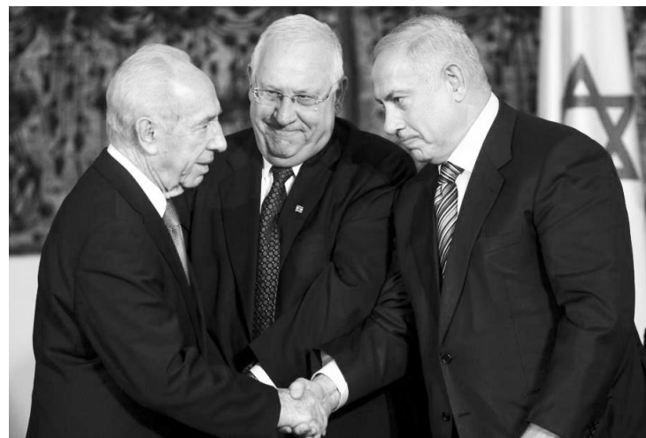
S leva na desno: Šimon Peres, Rubi Rivlin, Benjamin Natanjahu

Novi predsednik Kneseta, Rubi Rivlin, dobio je u drugom krugu glasanja u parlamentu 63 glasa od 116 prisutnih poslanika. Rubi Rivlin je iz iste partije, Likud, kao i premijer Benjamin Natanjahu, sa kojim je dolazio u sukob po nekim pitanjima. Posle izbora sledilo je pomire nje!