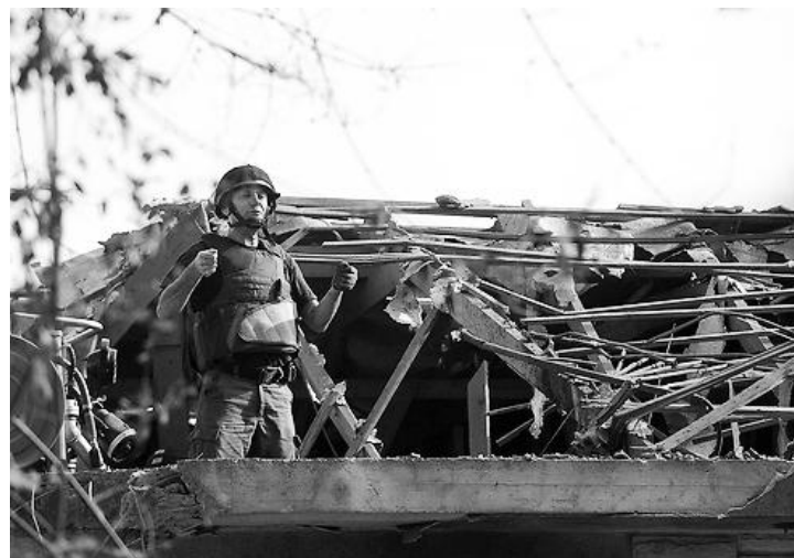
Raketa iz Gaze teško je oštetila kuću u elitnom delu Aškelona

To je medijski rat, ali onaj pravi rat ima svoje žrtve, koje su mnogo veće na palestinskoj strani. Ipak, svet bi trebalo da zna da se u izraelskim bolnicama leče ranjeni teroristi i civili, koji su povređeni u napadima na vojne ciljeve Hamasa. No, kada je raketama napadnuta velika bolnica Barzilaj u Aškelonu, dečije odeljenje, ta vest nije zaslužila osudu svetske javnosti za ovaj bezobzirni napad.