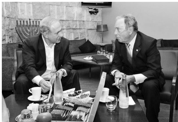
Premijer Izraela, Benjamin Natanjahu, primio je svjetskog filantropa Majkla Blumberga

Unatoč embargu američkih zrakoplovnih kompanija za sletanje na aerodrom Ben Gurion, kao posledica raketiranja zadnjih dana, Michael Bloomberg je opet dokazao da je prava osoba za dodjelu nagrade "Židovski Nobel". Filantropska Grupa Genesis osnovala je nagradu "Židovski Nobel" kako bi odala priznanje ljudima koji svojim zalaganjem izražavaju i podržavaju osnovne vrijednosti židovskog naroda, a to je nastojanje za poboljšanje ljudskog društva.