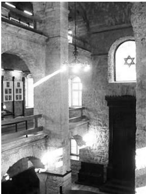
Sarajevski hram je prvo služio okupatoru kao sabiralište za Jevreje, a potom, tokom rata, kao zatvor – Danas se tu nalazi Sarajevski muzej

U toku 1942. godine još oko 300 uglavnom bosanskih Jevreja probilo se raznim kanalima na talijansko okupaciono područje , ali je odluka sa jezera Van Ze „O konačnom rešenju jevrejskog pitanja“, početkom 1942. Godine, inicirala dugotrajan višekalni pritisak na sve njemačke saveznike, satelite i kolaboracioniste, pa to nije mimoišlo ni Italiju.