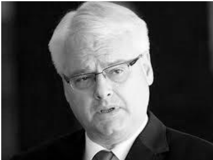
Predsednik Hrvatske dr Ivo Josipović

"Kao predsednik i kao građanin ove zemlje, Josipović je više puta jasno isticao da je takozvana Nezavisna Država Hrvatska bila zločinačka, i na ideji genocida zasnovana, politička tvorevina, koja je imala podršku okupacionih sila, te je i nastala u najvećoj meri kao njihov proizvod", ističe se u saopštenju koje je objavljeno na internet stranicama predsednika Hrvatske.