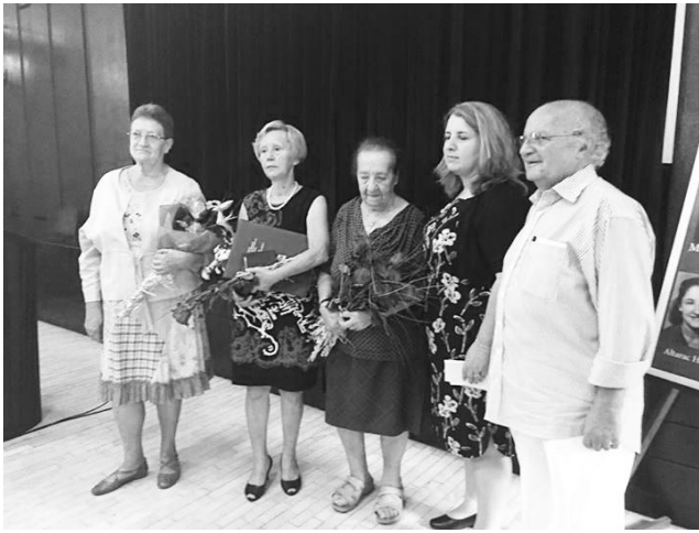
Biti komšija i prijatelj i danas je ideja vodilja članova porodica posthumno odlikovanih.