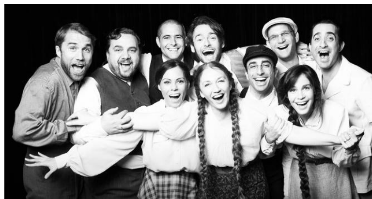
Tragedija i optimizam glumaca koji nam vraćaju nadu u bolje sutra

Predstava je ujedno lokalna i univerzalna, pripoveda o onome što se zaista dogodilo u selu Jedwabne u istočnoj Poljskoj 10. jula 1941. kada su Poljaci katolici upali u domove komšija Jevreja, sa kojima su odrastali, na silu ih zatvorili u ambar i spalili njih 1600.