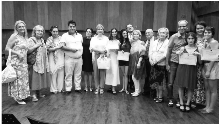
Sa završnog koncerta - fotografija za uspomenu na nezaboravni događaj

Svi učesnici masterclass-a učestvovali su na završnom koncertu, koji je, takođe, održan u sali kulturnog centra „Žerar Behar“. Puna sala je dugotrajnim i iskrenim aplauzom nagradila njihov nastup.