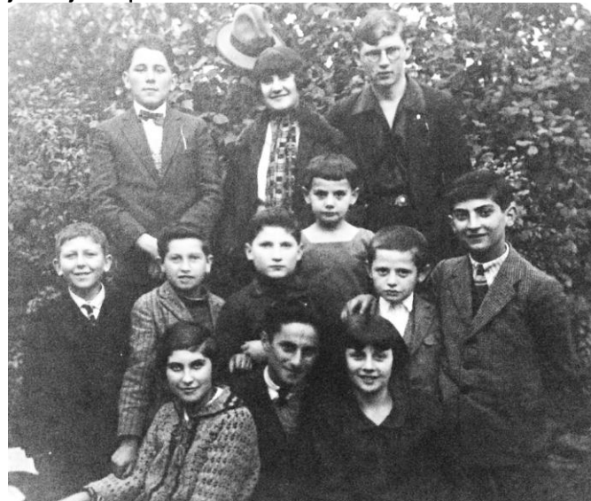
Deca Rume – malobrojni su preživeli

Sve je to bilo tako do okupacije 1941. god, a epolog za rumske Jevreje je bio katastrofalalan. Danas u Rumi nema ni jedne jevrejske porodice.