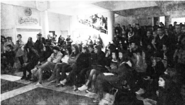
Javni čas u Šibeniku

Šibenik - Međunarodnom danu sjećanja na žrtve holokausta pridružili su se i učenici šibenske Medicinske i kemijske škole koji su program obilježavanja podijelili sa šibenskim medijima.