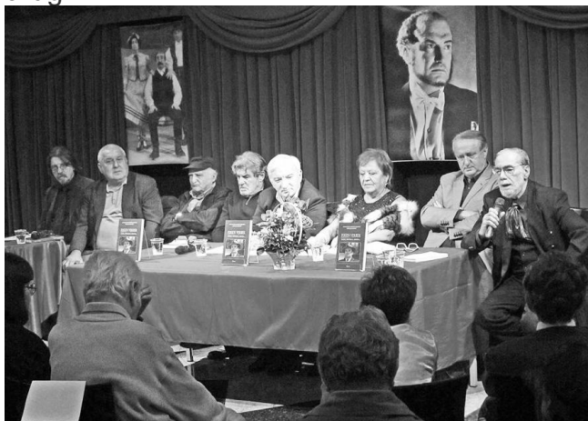
Promocija knjige je održana u Pozorištu na Terazijama

O najvećem judaisti sa naših prostora i cenjenom prevodiocu sa hebrejskog, aramejskog, jidiša i drugih jezika sa međunarodnom reputacijom. Bio je učesnik mnogobrojnih kongresa hebraista i judaista u svetu, prevodilac poznatih knjiga TALMUD, SARAJEVSKA HAGADA, KUMRANSKI RUKOPISI, KABALA I NJENA SIMBOLIKA, JEVREJSKE NARODNE BAJKE, UVOD U JEVREJSKU VERU, BIBLIJSKE PRIČE, DIBUK, SEDAM KČERI BEZ MIRAZA, KRŠĆANSTVO PRIJE KRISTA i mnogih drugih.