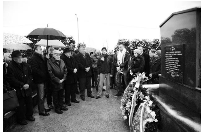
Podsećanje pored spomenika u Banja Luci

učiniti sve da se Holokaust više nikada ne ponovi, rekao je Livne novinarima. Podsjetio je da mu je kompletna porodica ubijena u Drugom svjetskom ratu.