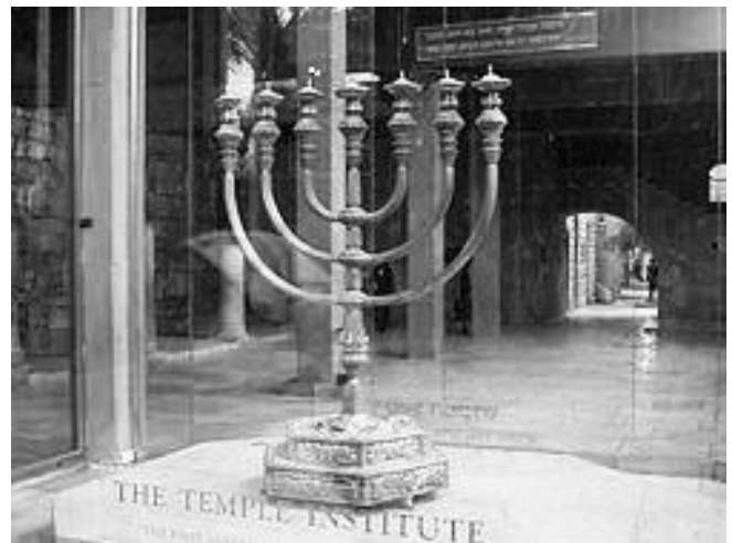
Replika menore po opisu iz Tore

U republici Makedoniji godinama se obeležava Dan Holokausta u martu mesecu, kada je 1943. godine skoro celokupna jevrejska populacija, oko 7.200 Jevreja, deportovana u Treblinku. Niko se nije vratio.