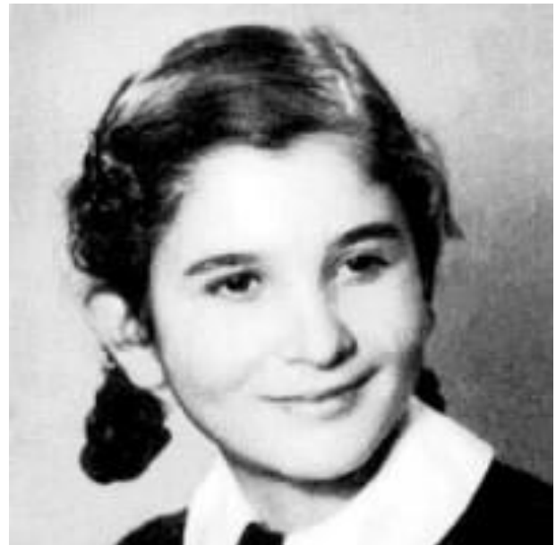
Reli je na početku rata imala 12 godina

je ostala skrivena kod tetke. Niko od najbliže porodice nije se posle rata vratio kući.