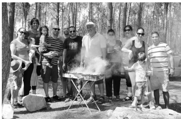
Dim se širio na mestu gde smo se okupili, ali niko se nije žalio. Svi su znali da stiže ukusan zalogaj sa roštilja.