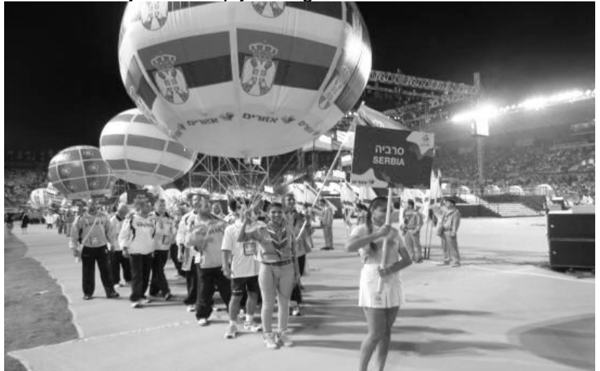
Balon sa državnim oznakama iz Srbije - najbrojnija ekipa iz bivše Jugoslavije

Na otvaranju Makabijade bilo je prisutno oko 40.000 gledalaca i to većinom sa plaćenim ulaznicama! Makabijadu je svečano otvorio predsednik Izraela Šimon Peres, a baklju je zapalila Ali Rajsman, američka gimnastičarka, dobitnik zlatne medalje na olimpijskim igrama.