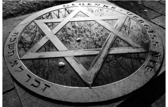
Davidova zvezda u Rostoku – „Zapamti, nikad ne zaboravi“

hrabrost i spreče bilo koji oblik antisemitizma, koji se ne toleriše." Ona se požalila da je "gotovo neobjašnjivo, ali i realnost, da nijedna jevrejska institucija ne može da opstane bez policijske zaštite."