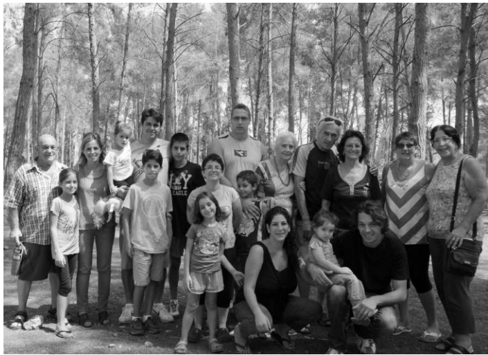
Mladi, hvala Bogu, osvajaju svet!

Ove godine kao da nas je bilo manje nego obično. Zato je atmosfera, kao i uvek, bila odlična. Sreli su se stari prijatelji, što baš i nemamo često prilike, s obzirom da živimo širom Areca, a i godine nas stižu... Ipak, sve više dece vidamo na našim susretima, tako da će, verovatno, tradicija okupljanja biti sačuvana. Jedino što bih mogao da preporučim organizatorima da ne menjaju mesto sastanka. Možda je to razlog što nas je bilo manje na jednom mestu.