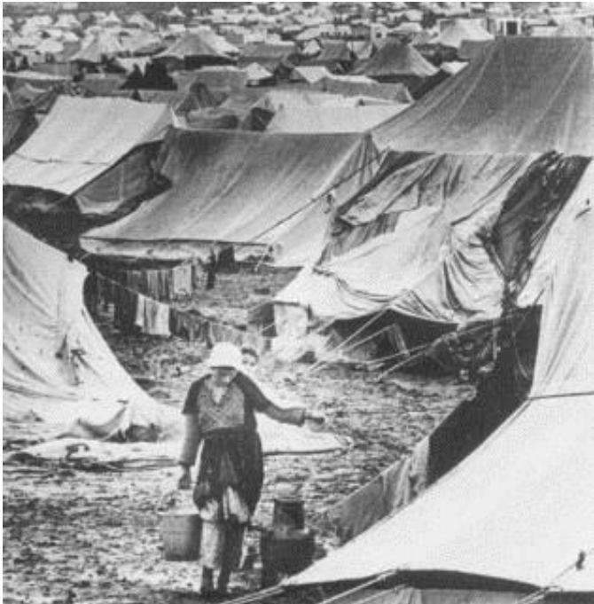
Maabarah – kamp za jevrejske izbeglice

Prema podacima Ujedinjenih nacija procenjuje se da u svetu ima oko 65 miliona izbeglica. Verovatno ovaj podatak za mnoge ne znači ništa, sve dok se ne spomenu palestinske izbeglice. Tog momenta počinje napad na izraelsku politiku, a nikom ne pada na pamet da kaže koliko je u isto vreme bilo jevrejskih izbeglica, proteranih iz arapskih zemalja.