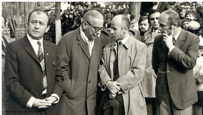
Ivo Andrić u Travniku 1972.

da Vam kažem, Vi ste više od svih nas i Srbin i Hrvat, i jedno i drugo zajedno'. Andrić je sebe smatrao delom integralnog jugoslovenskog i književnog prostora“, rekla je Đukić-Perišić.