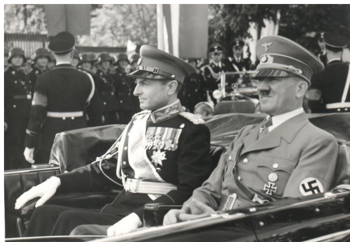
Knez Pavle u poseti Berlinu

Potpisnici i glasnogovornici pristalica rehabilitacije narodnih neprijatelja, ratnih zločinaca, fašista obično govore o falsifikovanju istorije, optužujući za to komunistički režim. Najčešće je korišćen argument da su komunisti falsifikovali suđenje Draži Mihailoviću. Po njima sve je falsifikat, pa čak i dokumentarni filmovi koji su snimljeni za vreme suđenja, kao i ceo zapisnik. Komunisti su sve falsifikovali, jedino je ostalo nejasno kako su komunisti uspeli da falsifikuju susret Kneza Pavla 1939. godine sa Hitlerom, kome je obećao saradnju, kao i kako su snimljene, verovatno kao u nekom holivudskom filmu, demonstracije 27. marta 1941. godine u Beogradu, kada je odbačen Trojni pakt, i kada su građani Beograda i dela Srbije uspeli da sa časnim vojnicima obore vladu, a predsednika vlade Cvetkovića, koji je potpisao Trojni pakt, stave u zatvor.