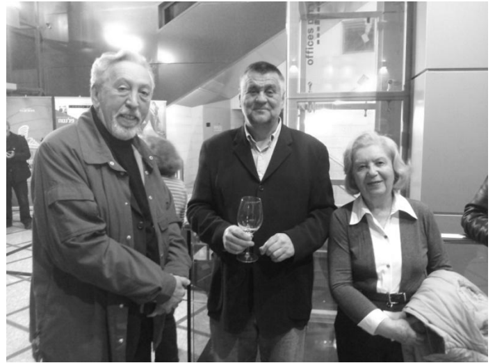
Rajko Grlić (u sredini) sa aktivistima HOJ-a

Posle projekcije filma „Neka ostane među nama“, savremeni hrvatski film, režiser Rajko Grlić je na pitanje gledalaca da li oseća jugonostalgiju odgovorio: „Nisa jugonostalgija, jer, ako ne govorimo o politici, za mene se ništa nije promenilo. Moja majka je za svog života živela u pet država, a uvek je pripadala istom mestu, Zagrebu... I ranije, dok smo živeli u jednoj Jugoslaviji, filmovi su snimani u raznim republikama i nosili su epitet republike odakle su poticali autori. Ono što je mnogo važnije jeste da je uvek postojala saradnja između filmskih radnika sa prostora bivše Jugoslavije, a postoji i danas, samo se ta koprodukcija drugačije zove“. Grlićev film, „Neka ostane među nama“, ne bavi se politikom, ali i to može biti određen politički stav. Film govori o bolje stojećoj srednjoj klasi u Zagrebu, a načinom na koji je prikazan, sa puno humora, dok se govori o najozbiljnijim porodičnim i međuljudskim problemima, osvojio je publiku, koja je toplim aplauzom pozdravila autora filma.