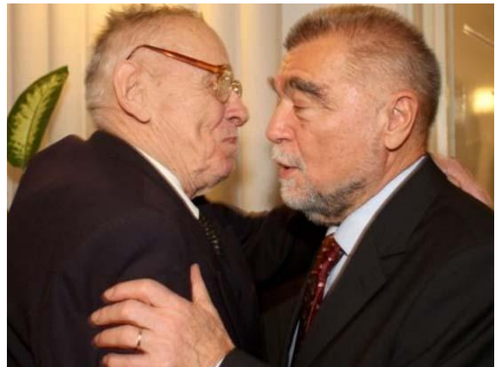
Josip Boljkovac i Stipe Mesić

Zuroff u svojoj poruci podsjeća da smo posljednjih godina svjedoci opasnih pokušaja da se ponovo piše povijest Drugoga svjetskog rata i da se ukloni krivnja s onih koji su odgovorni za Holokaust i druge zločine protiv civila. - Dio je te kampanje nastojanje da se neutemeljeno izjednače zločini nacista, a u Hrvatskoj ustaša, s onim zločinima što su ih počinili komunisti - poručio je Zuroff.