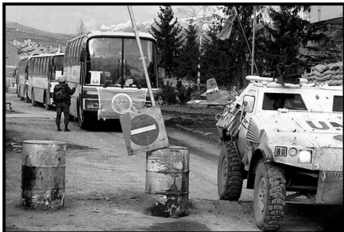
Konvoj u pratnji UNPROFOR-a napušta Sarajevo

Ono što sigurno znam, da je prije 25 godina, u periodu 1992/1993. oko 1.000 Jevreja napustilo Bosnu i Hercegovinu, nastavljajući zlu sudbinu odlazaka iz Domovine.