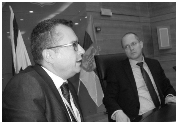
Dobitnika Povelje je i ambasador Srbije