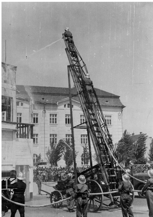
Prisutnima je prikazan rad lestvi koje su se uspravile i podigle na 33 metra za 15 sekundi.

pumpama domaće fabrike „Brod“ i novih automatskih lestvi METZ. O značaju ovih nabavki svedoči podatak da je spravama kumovao predsednik Senata Kraljevine Jugoslavije dr Anton Korošec.