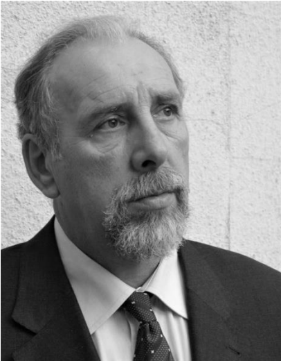
Piše Nenad Fogel

Jevreji su organizovano počeli da naseljavaju Zemun 1739. godine. Zahvaljujući državnoj politici dugo godina bili su na marginama društvenog života. O tome svedoči i dugogodišnja borba sa vlastima da im se dozvoli podizanje sinagoge. Konačno, posle više od 110 godina, dobili su dozvolu za podizanje aškenskog hrama. Gradnja sinagoge počela je 1850. a osvećena je 1863. godine. Značaj podizanja sinagoge kao dela jevrejskog kulturnog centra sa školom i opštinom bio je višestruk.