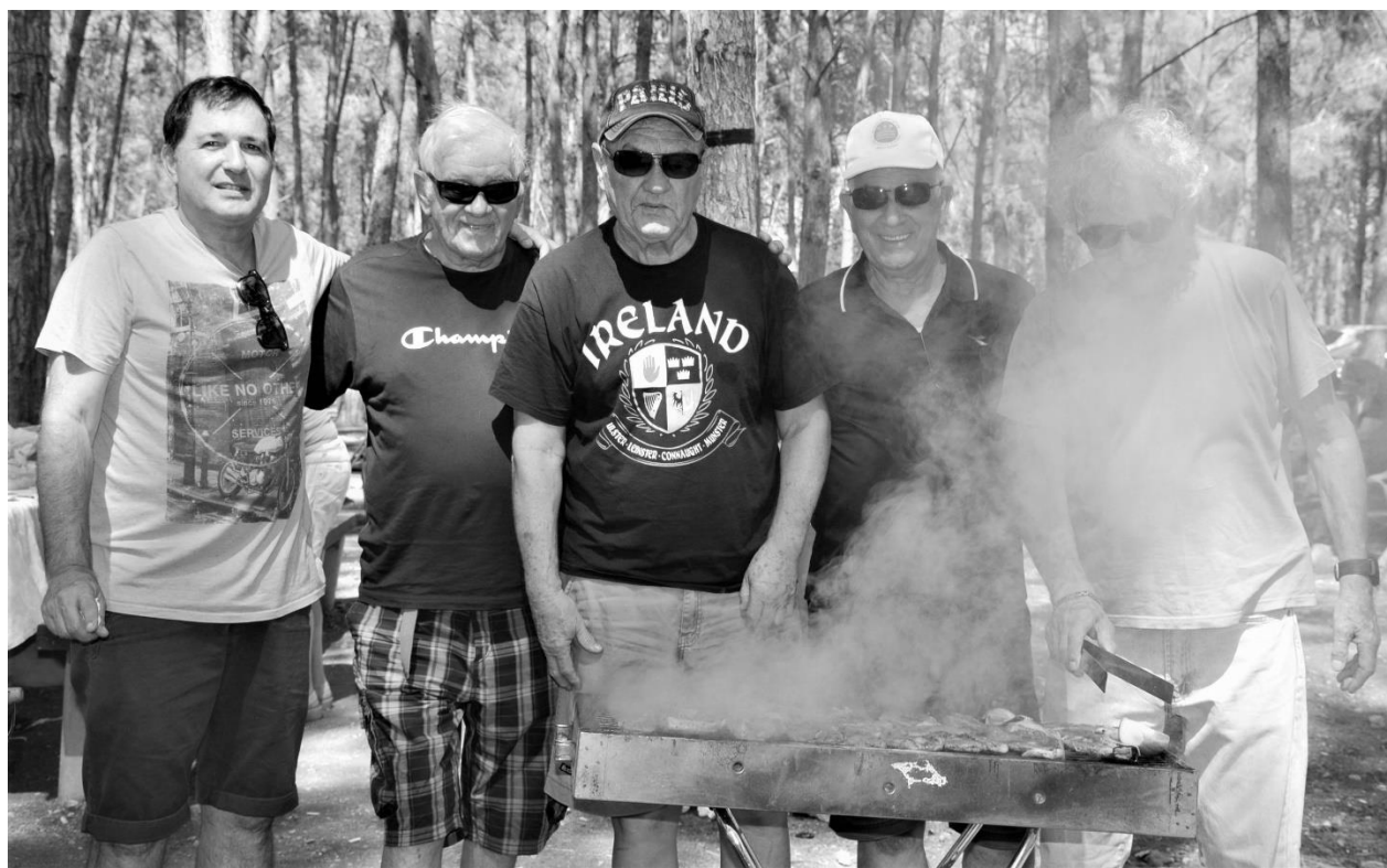
Zar još uvek ima neko ko bi mogao da zamisli izlet u prirodi bez roštilja!