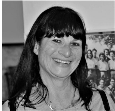
Piše MIRI DERMAN