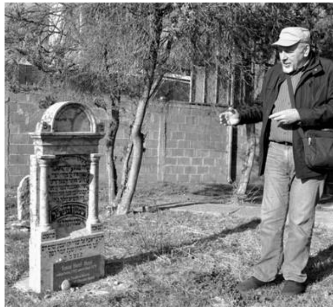
Spomenik Teodorovih babe i dede