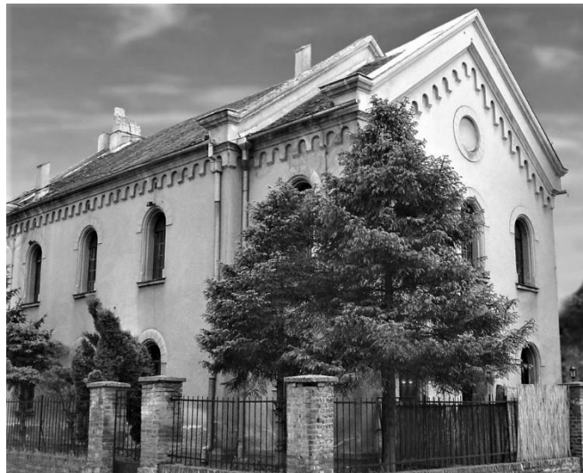
Sinagoga u Zemunu, podignuta 1850.

Sigurno ste znali puno više o Teodoru Herclu, ali verujemo da je sada sasvim jasno zašto je Srbija odlučila da nazivom ulice oda poštovanje utemeljitelju moderne države Izrael.